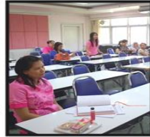
Road Show คณะวิทยาศาสตร์และเทคโนโลยี