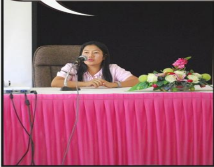
Road Show คณะวิทยาการจัดการ