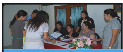
โครงการอบรมเชิงปฏิบัติการเตรียมบุคลากรพร้อม รับการตรวจประเมินคุณภาพการศึกษาภายใน ประจำปีการศึกษา 2555 ระดับคณะ/สำนัก/ศูนย์ฯ/โปรแกรมวิชา