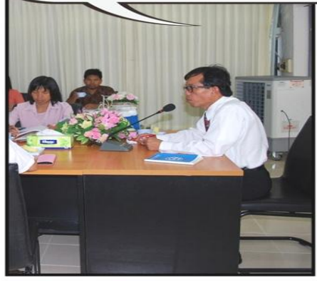
Road Show คณะมนุษยศาสตร์และสังคมศาสตร์