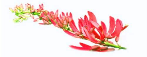
ดอกปาริฉัตร